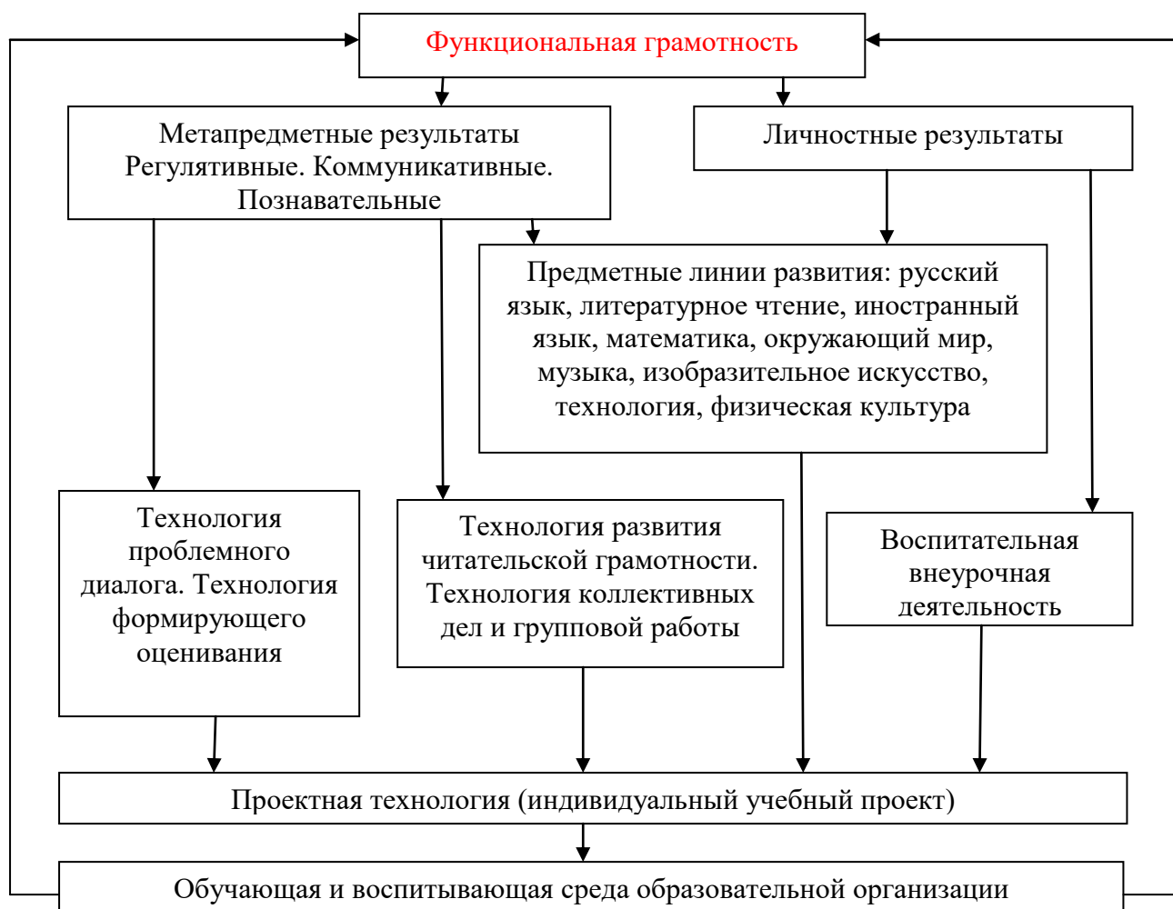
Схема «Система работы школы по обеспечению личностных и метапредметных (УУД) результатов школьников»