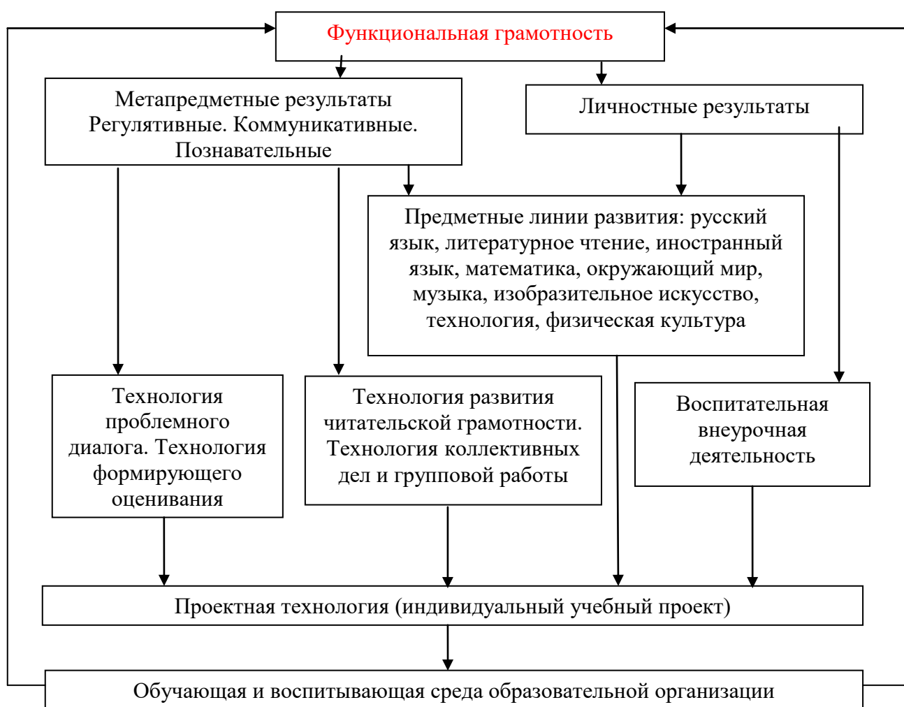
Схема «Система работы школы по обеспечению личностных и метапредметных (УУД) результатов школьников»